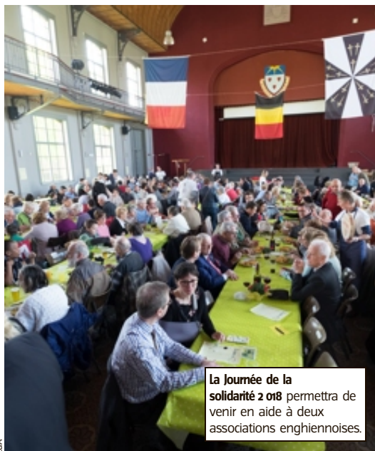
La Journée de la solidarité 2018 permettra de venir en aide à deux associations enghiennoises.

Pour y parvenir, cette poignée d'Enghiennois a décidé de mettre sur pied une journée qui débute à 10 h 30 par une « gratifieria » (sic) : une bourse